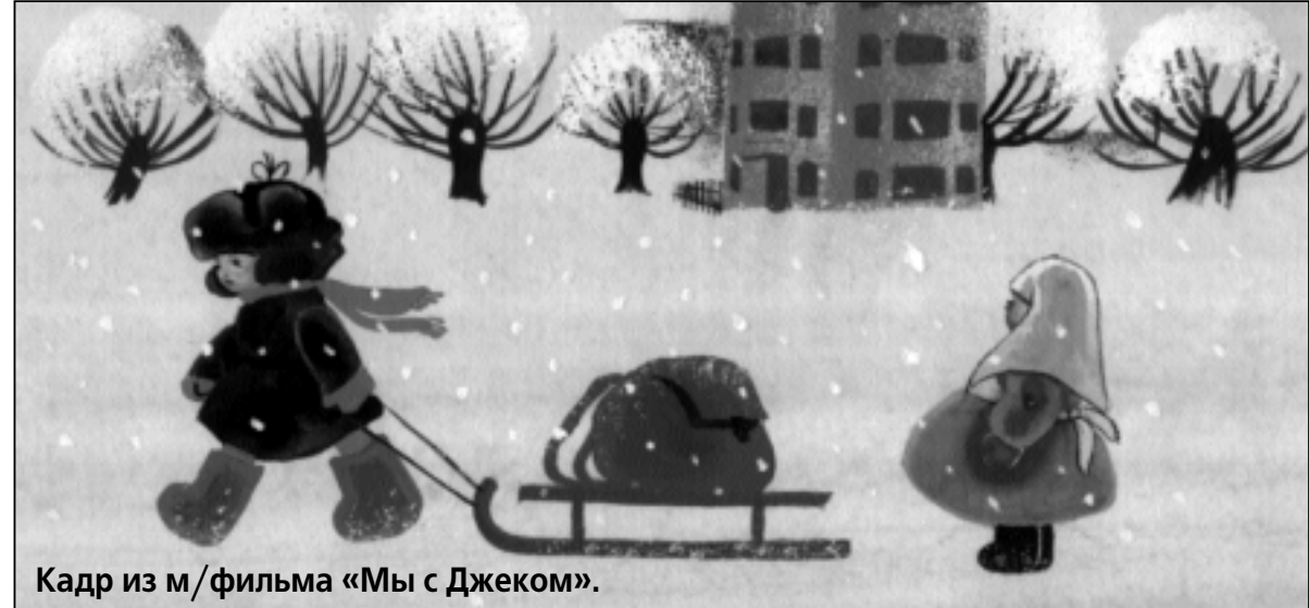
Кадр из м/фильма «Мы с Джеком».