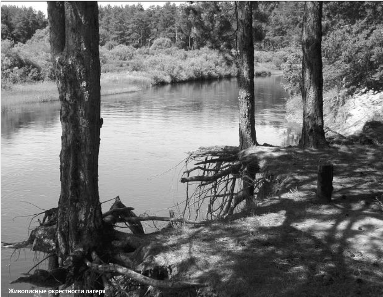
Живописные окрестности лагеря

Лето в нашей полосе имеет особенную ценность, потому что оно позволяет привыкнуть к теплу, глядишь, уже пора снова укутываться. Наверное, о том, что готовить сани нужно летом — уж больно быстро оно проходит. Кроме того, лето обычно — пора отпусков, а для школьников и студентов. На несколько месяцев можно забыть обо всех кошмарах, связанных с учебой, накопить достаточно хороших воспоминаний, на которые лето так и просит.