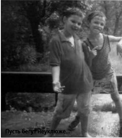
Пусть бегут неуклюже...

Лето в нашей полосе имеет особенную ценность, потому что оно позволяет привыкнуть к теплу, глядишь, уже пора снова укутываться. Наверное, о том, что готовить сани нужно летом — уж больно быстро оно проходит. Кроме того, лето обычно — пора отпусков, а для школьников и студентов. На несколько месяцев можно забыть обо всех кошмарах, связанных с учебой, накопить достаточно хороших воспоминаний, на которые лето так и просит.