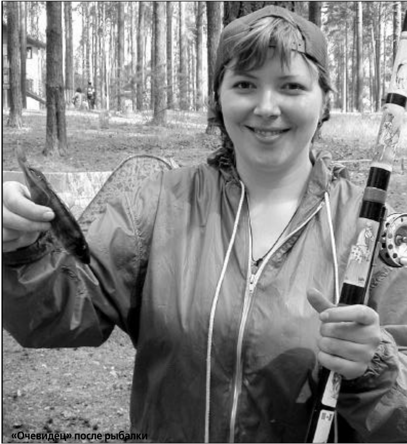
«Очевидец» после рыбалки