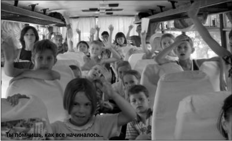
Ты помнишь, как все начиналось...