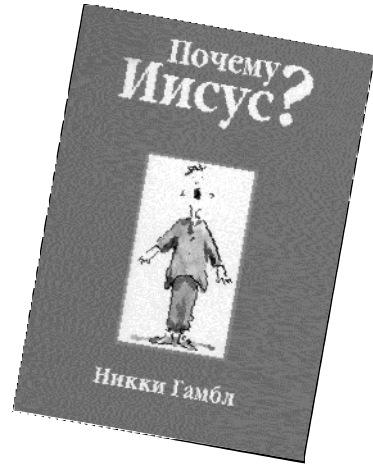
Никки Гамбл «Почему Иисус?» — евангелизационная брошюра. Практически это модифицированная первая глава книги «Вопросы жизни».