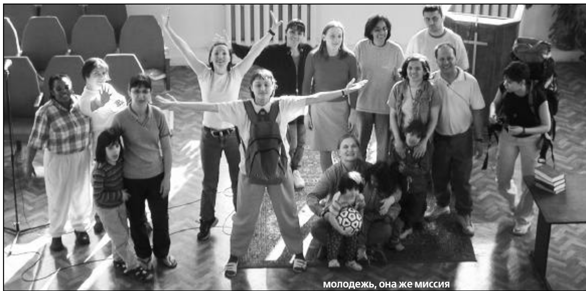
молодежь, она же миссия

— Студенты здесь живут временно, а вот миссионеры действительно оторваны от дома, так как здесь все-таки миссионерская база.