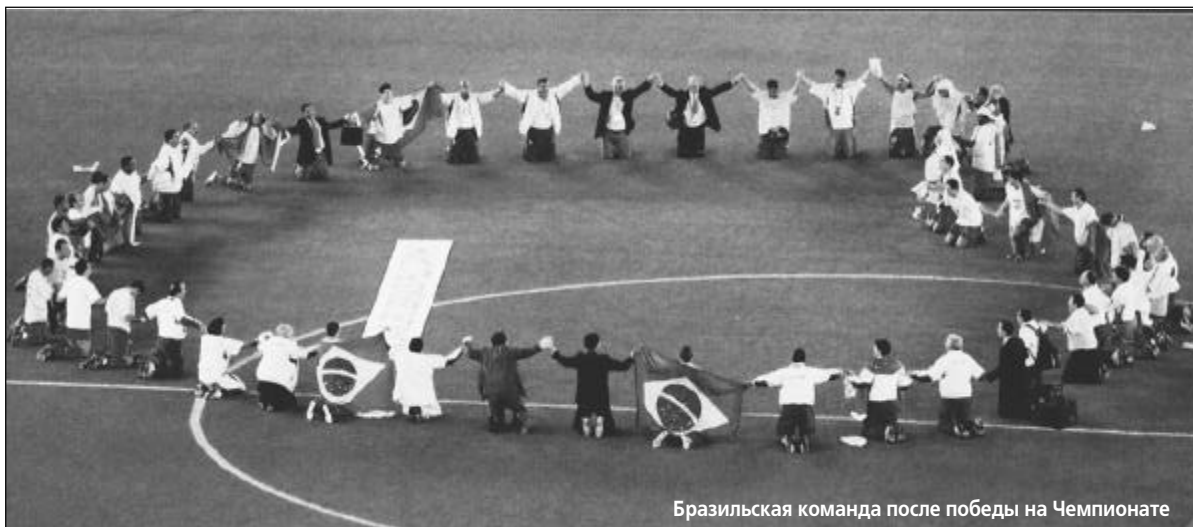
Бразильская команда после победы на Чемпионате

Так что же мы хотим от них, когда речь заходит о рекламе веры? За это никто не платил. А она сплошь и рядом. Тот же Семин в интервью после победы над ЦСКА в «золотом» матче сказал следующее: «Это